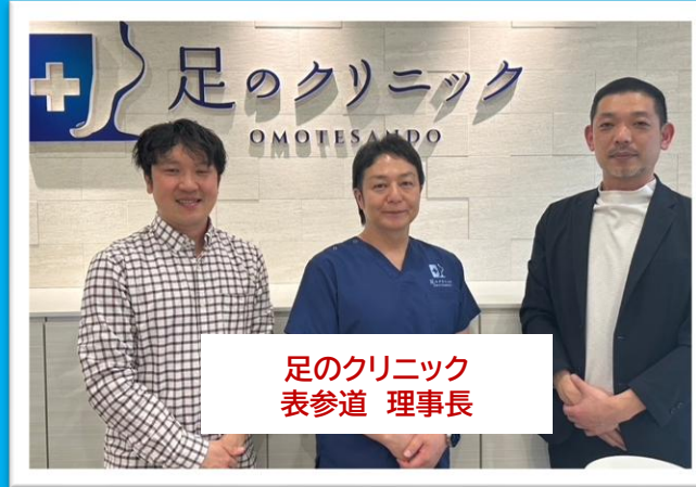
足のクリニック 表参道 理事長