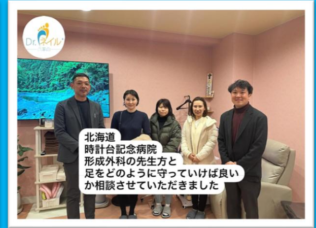
北海道 時計台記念病院 形成外科の先生方と 足をどのように守っていけば良い か相談させていただきました