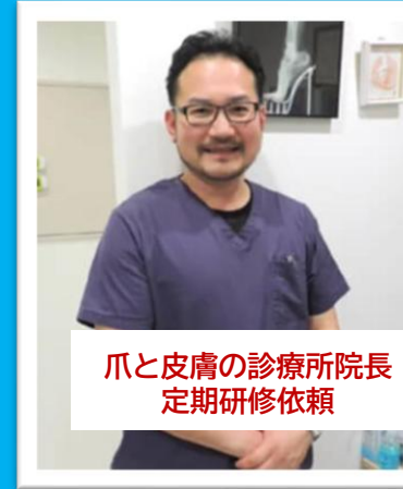
爪と皮膚の診療所院長 定期研修依頼