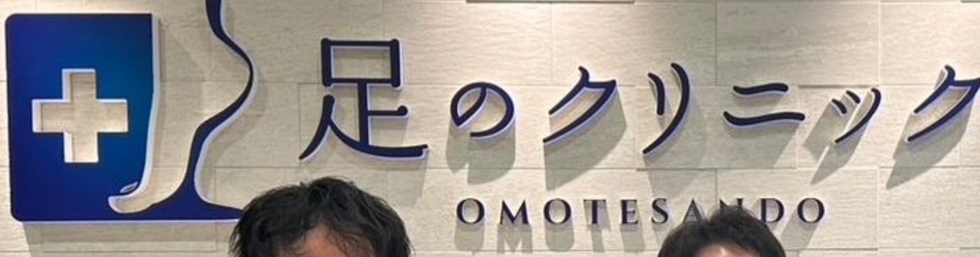
ドクターネイル爪革命さいたま院長 順天堂足の疾患センター非常勤