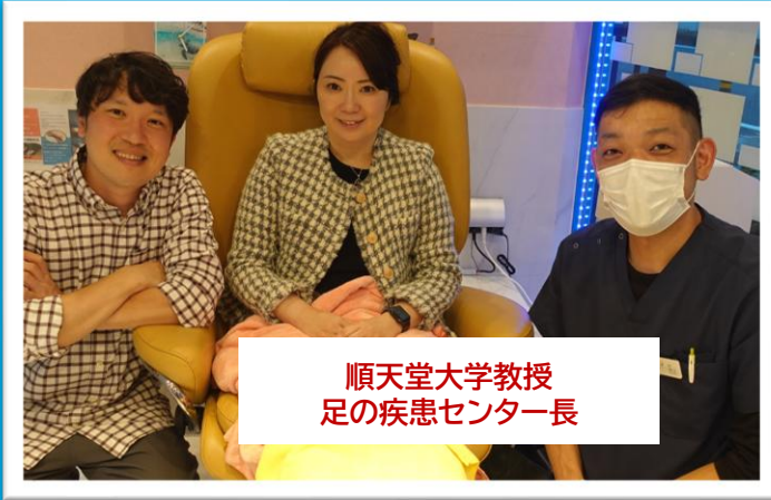
順天堂大学教授 足の疾患センター長